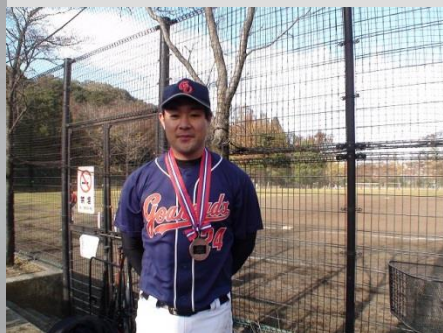
2本のHRで敢闘賞受賞

本日は 神奈川区民大会 準決勝、相手は ここまで圧勝で勝ち上がってきた1部の強豪 横浜ブルーボーイズ。結果は惜しくも2-7で敗戦…悲願の決勝進出を阻まれました。